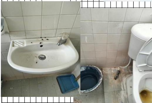
COMBO SANITARIO BAÑO