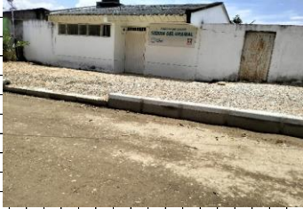
FACHADA CENTRO DE SALUD